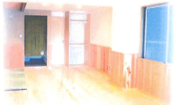
設計監理：くもん建築設計室 施工：根岸工務店（足立区）